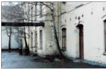
VASKERI: Denne bygningen inneheldt opprinneleg både to straffeceller, smie, fargereri, teppevaskeri, ullvaskeri og lagerrom.