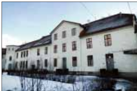
SJUKEHUS: Fattigsjukehuset, som er ein del av Prinds Christian Augusts Minde, er teikna av arkitekt Christian Henrik Grosch, som mellom anna også har teikna Børsen.